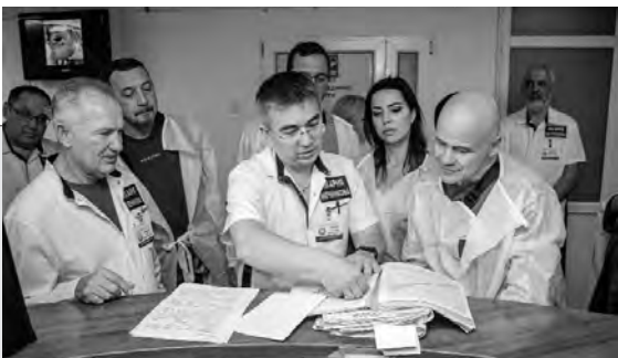
У комітетах Верховної Ради